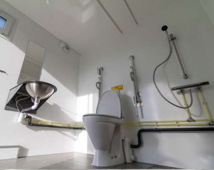
REMOLQUE DE SANITARIO ACCESIBLE 240